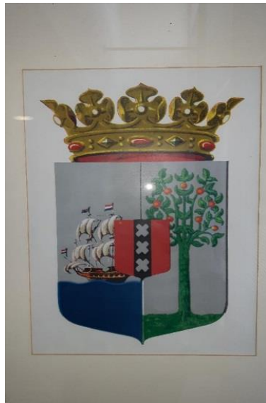
Officieel wapen Curaçao