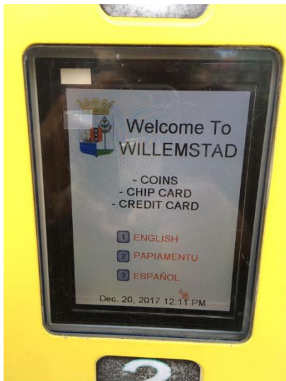
Figuur 3 Foto december 2017

Wij hebben in december 2017 geconstateerd dat bepaalde parkeermeters voorzien zijn van de afbeelding van het wapen van Curaçao (zie figuur nr. 3). In de bespreking met PAC in januari 2018 hebben wij aan hen gevraagd of zij toestemming hebben gekregen van de overheid om de afbeelding van het wapen op hun parkeermeters te