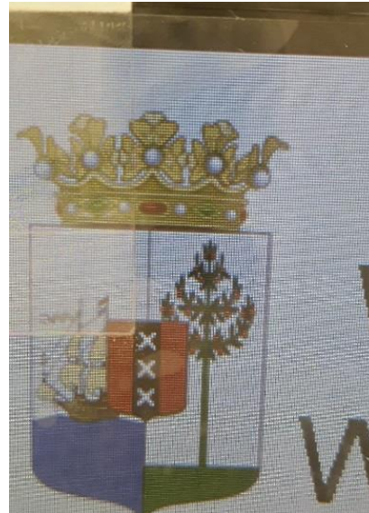
Wapen op parkeermeters PAC

Wij hebben niet kunnen vaststellen of door het Land richtlijnen zijn uitgevaardigd die het gebruik en/of wijzigen van het wapen van het Land of het ontwerpen en gebruiken van een eigen wapen regelt.