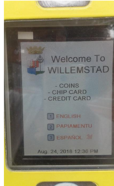
Figuur 4 Foto augustus 2018

plaatsen. De directeur gaf aan niet op de hoogte hiervan te zijn. Bij navraag door hem binnen zijn organisatie bleek dat zij geen toestemming hiervoor hebben. De directeur heeft aan ons medegedeeld dat zij ervoor zullen zorgen dat de afbeelding van de machines wordt verwijderd. Wij